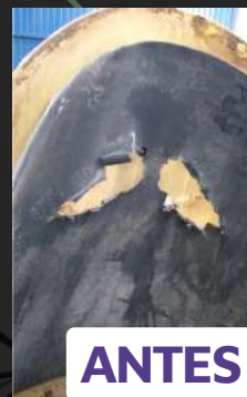
Outros revestimentos difundidos no mercado