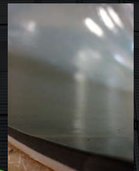
Close no RPAP aplicado no Cone