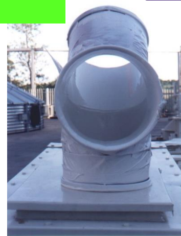
Curvas de passagem