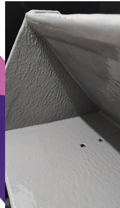
Canecas Elevador de Fertilizantes