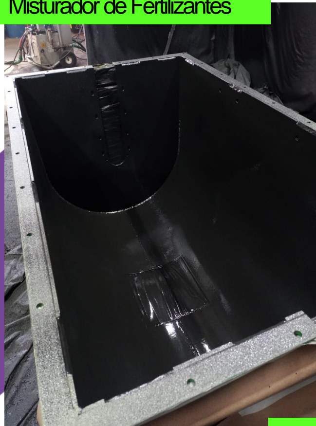
Misturador de Fertilizantes